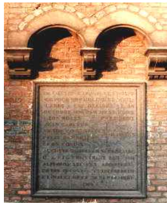
Voorlopig nog bewaarde gevelsteen

In 1985 bekam het O.C.M.W. van de stad Leuven de uiteindelijke slopingsvergunning voor het grootste gedeelte. In september 1985 beukten de slopershamers in de Frederik Lintsstraat, op twee weken tijd, een trots Belle-Epoque gebouw, met een gevelbreedte van 140 m en een bouwdiepte van 45 m, tegen de vlakke om plaats te ruimen voor een 'voorlopige' parking. Het instituut was slechts gedurende 57 jaar in gebruik, verkommerde daarna gedurende 25 jaar en verdween dan plots uit het straatbeeld als parking in concessie, uitsluitend in gebruik voor de K.U.Leuven. Enkel de inhuldigingsplaat centraal op de gespaarde achterbouw getuigt voorlopig nog van de grootsheid en het bestaan van het gebouw dat eens het statige hart vormde van deze straat.