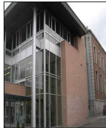
Stadhuis Diest oud en nieuw

Menu : Soep van de dag – 1 Orloffgebraad met pepersaus of 2 Kabeljauwfilet met groentjes – Koffie met dessert.