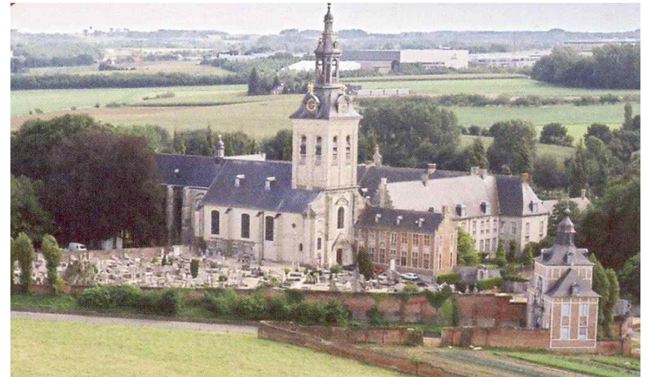
De Parkabdij (Uit brochure De Toekomst van een rijk verleden)

Anders dan de vele andere abdijcomplexen in het Leuvense is de abdij van Park vrijwel ongeschonden bewaard gebleven. Enkel een paar bijgebouwtjes (één van de twee watermolens, de bakkerij en de brouwerij) zijn verdwenen. Mede dankzij het feit dat de abdijomgeving toevallig tussen twee samenlopende spoorweglijnen is komen te liggen werd de oprukkende stad tegengehouden. Als een groene wig dringt het abdiydomein zich nu in de sterk verstedelijkte omgeving. Via bruggetjes over de spoorwegen kan de gestresseerde stedeling nu onderduiken in een stukje agrarisch landschap. In het Zuiden wordt deze groene driehoek begrensd door de rij van vier in elkaar overlopende visvijvers, waardoor de abdijsite een gesloten geheel vormt.