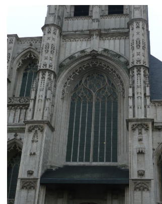
Plaats orgel aan westgevelraam

Leuven is een orgelstad. Met een orgel van het kaliber van het Contius orgel (het grootste – en het beste ooit- van Europa – zeggen “ze”) kan het niet anders of van de hele wereld zullen de beste orgelisten smeken om het te mogen bespelen. Van over héél de wereld zal volk toestromen. Leuven zal op de wereldkaart staan niet alleen als bierstad, maar ook als orgelstad.