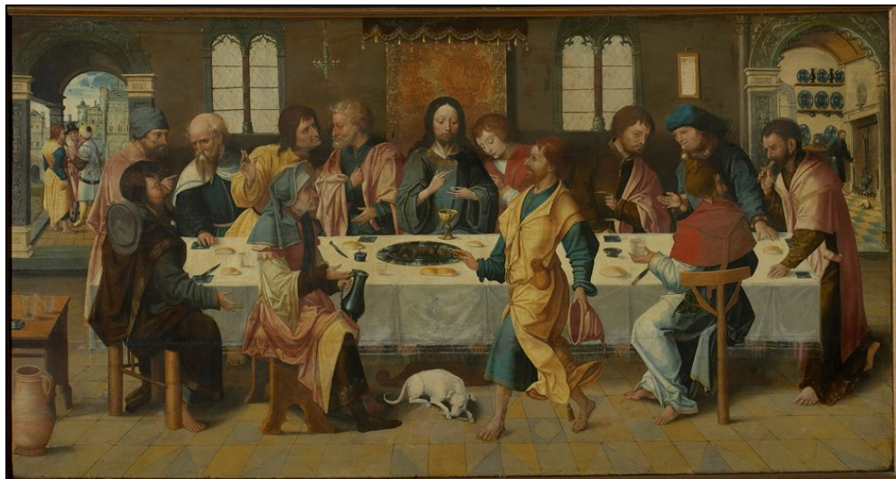
Jan Willems, 'Laatste Avondmaal', 1521, Sint-Kwintenskerk, Leuven, Foto: Copyright KIKIRPA, Brussel, Cliché nr. X007739, Object nr. 58402.

Dit werk, van de stadsschilder Jan Willems, geniet de laatste tijd een toenemende bewondering van de vele bezoekers tijdens de zomermaanden.