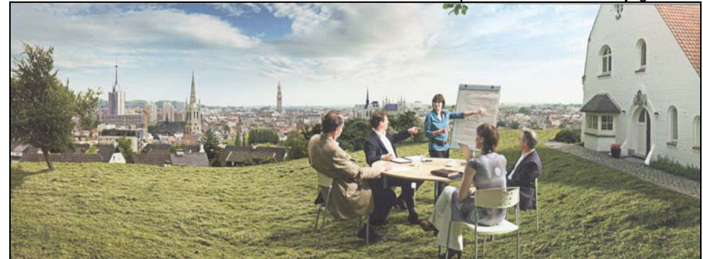
Uitzicht op de stad Leuven als historisch gegeven. Evocatie