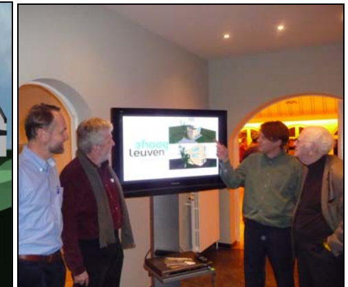
Project voor de uitbreiding Museum -Congres Projectuitleg aan LHG over '3hoogleuven'