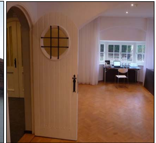
Binnenzicht, deel van de gerenvoerde Villa