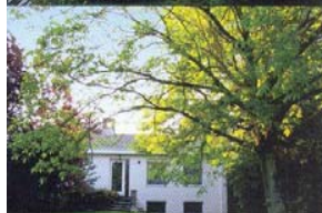
bestaande situatie voor

Ondanks een positieve reactie van de Dienst Monumenten en Landschappen naar aanleiding van het initiatief van het LHG om deze site alsnog te valoriseren, bleef het bij deze ruggensteun, maar kon er geen wettelijk kader op zo een korte tijd gerealiseerd worden.