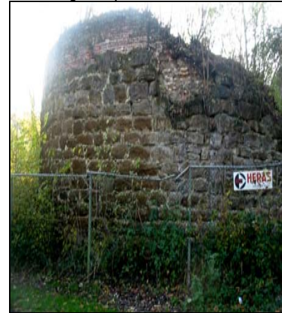
Restant Verloren Kost-toren - Mechelsevest.