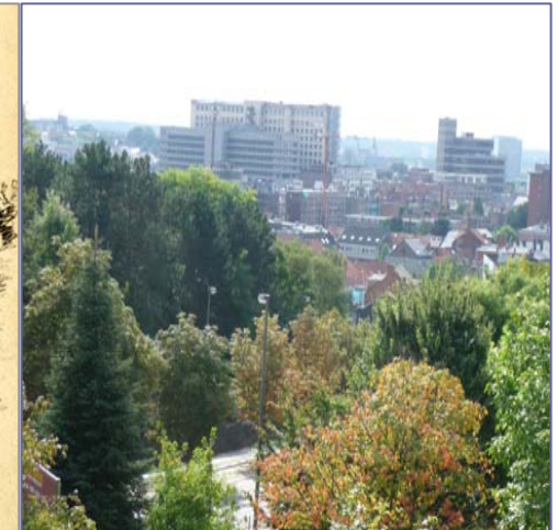
Zicht vanuit de site anno 2008