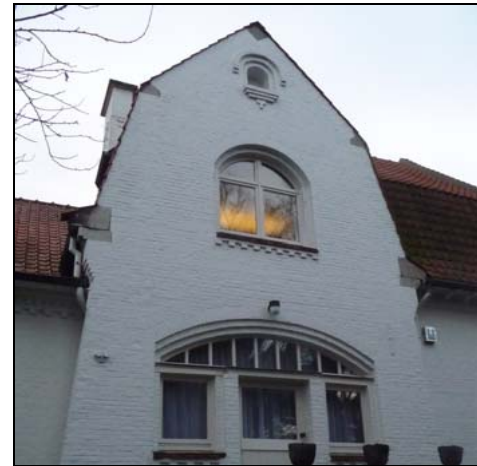
Gerenvoerde gevel van de Witte Villa

Een onverwachte wending, een goeie start en een hart onder de riem voor wie gelooft dat het informeren en het verdedigen van ons erfgoed soms loont. Een pluim voor 3hoog Leuven en hun medewerkers. We duimen voor hen!