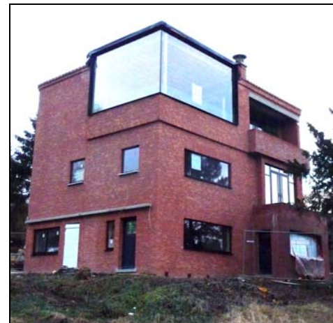
2008 vernieuwd 'Bauhaus' strak, functioneel