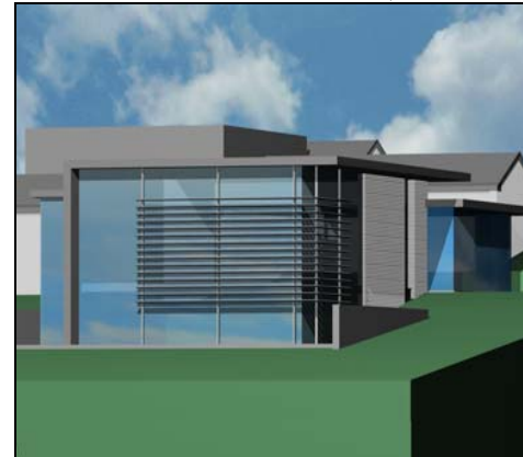
Project voor de uitbreiding Museum -Congres Projectuitleg aan LHG over '3hoogleuven'