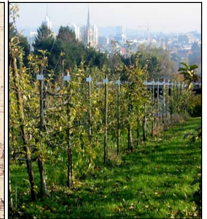
Uitzicht op Leuven vanuit de wijngaarden