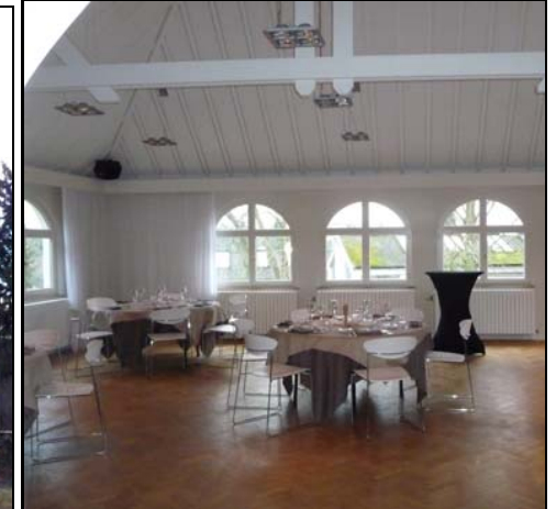
Gerenvoerd atelier van de Witte Villa