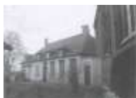
boven: klooster-kapel onder: godshuis-kapel

Een onherstelbare beslissing om de geschiedenis van de stad Leuven te miskennen. Ook de fundamenten uit de 13de eeuw van het eerste klooster van de Minderbroeders ligt in de tweede zone. Wat het LHG vreesde werd hier bewaarheid. Waardevolle restanten verdwenen in een snel tempo. Beenderen en skeletdelen van relictien van het voormalig middeleeuws Geuzenkerkhof werden zonder respect overhoop gehaald. (zie foto 5)