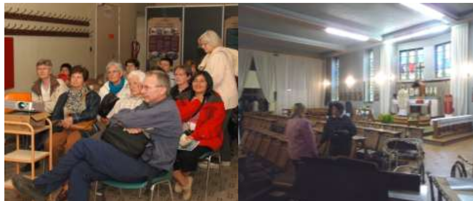
Enkele sfeerfoto's van de erfgoeddag 2009 .