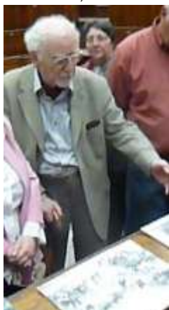
Voorzitter PR op Erfgoeddag

Het monumentale standbeeld - vandaag op de dool - van de in Leuven geboren Sylvain Van de Weyer was de aanleiding om ook de vroegere verblijfplaats van dit standbeeld, het Monseigneur Ladeuzeplein even op te frissen.