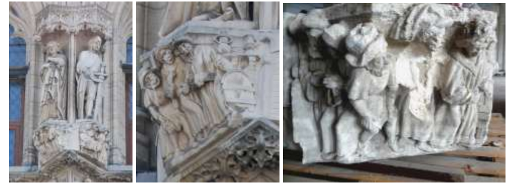
Beeld - kraagsteen uit gevel stadhuis 2009 - detail kraagsteen (nr.138) uit de gevonden reeks (Foto LHG)

Te koop aan 10€ zwart/wit of 20€ kleur voor leden en meerprijs 5€ voor niet-leden), enkel af te halen op het secretariaat, open elke zaterdag van 10u-12u, één week na telefonische bestelling, via LHG, nr. tel. 016/460422 Brusselsestraat 46/05, 3000 Leuven.