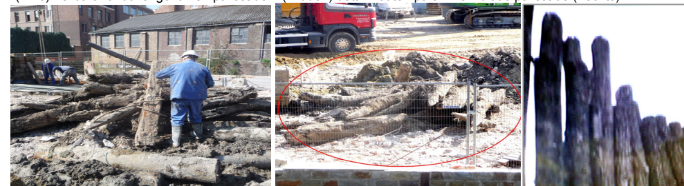
(links) Barbarahof bovengekomen palissade – (midden) detail houten palen – simulatie palissade ( rechts)

Minimaal had men de fragmenten van de palen kunnen beschermen en aan een steekproefonderzoek kunnen onderwerpen. Het verwondert ons dat deze mysterieuze en 'oude' paalelementen onafgedekt in de zon en regen bleven liggen (zie foto 6 en 7) en thans verdwenen zijn. We mogen veronderstellen dat deze houten palen, met een dergelijke lengte en met puntvormige uiteinden, die nu toevallig bovenkwamen bij een lukraak graven van een sleuf, deel uitmaken van een groter geheel.