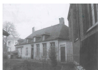
boven: klooster-kapel onder: godshuis-kapel

Een onherstelbare beslissing om de geschiedenis van de stad Leuven te miskennen. Ook de fundamenten uit de 13de eeuw van het eerste klooster van de Minderbroeders ligt in de tweede zone. Wat het LHG vreesde werd hier bewaarheid. Waardevolle restanten verdwenen in een snel tempo. Beenderen en skeletdelen van relictien van het voormalig middeleeuws Geuzenkerkhof werden zonder respect overhoop gehaald. (zie foto 5)