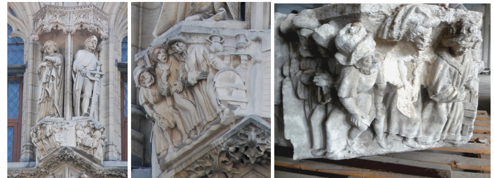
Beeld - kraagsteen uit gevel stadhuis 2009 - detail kraagsteen (nr.138) uit de gevonden reeks (Foto LHG)

Te koop aan 10€ zwart/wit of 20€ kleur voor leden en meerprijs 5€ voor niet-leden), enkel af te halen op het secretariaat, open elke zaterdag van 10u-12u, één week na telefonische bestelling, via LHG, nr. tel. 016/460422 Brusselsestraat 46/05, 3000 Leuven.