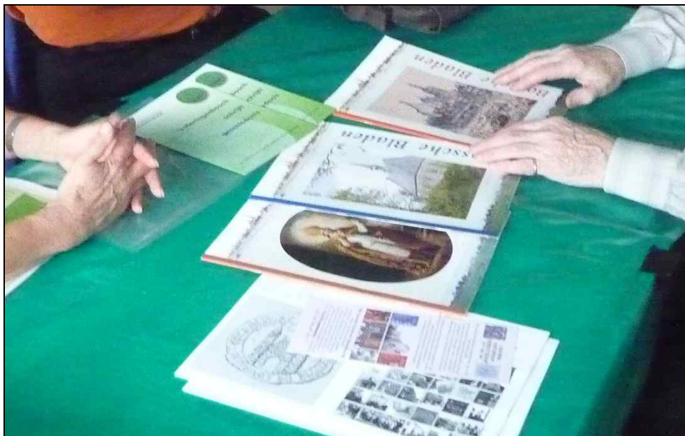
LHG en De Boschboom wisselen publicaties uit - Uitwisseling geschenken tussen zusterverenigingen

De Boschboom uit 's-Hertogenbosch legt zich toe op cultuur en historie als breed werkveld, terwijl het LHG zich meer profileert als historisch genootschap dat ook de patrimoniumzorg benadrukt.