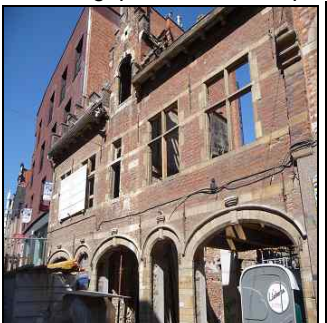
Afbraak gepland historisch pand 'Vrieslandt' hoek Brusselsestraat (130) - P. Coutereelstraat

Het pand Vrieslandt, later het Caetspel, genoemd naar het befaamde Caetspel, wordt reeds vermeld in 1512 als brouwerij en was ooit gehuurd door de faculteit van de Artes. Deze afbraak is gepland om plaats te maken voor een winkel en appartementen.