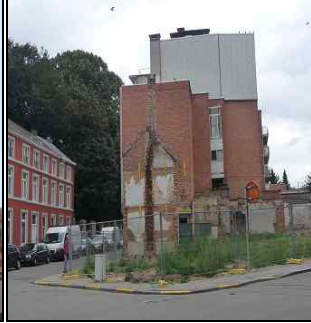
Afbraak 'de Zeesnoeck', oud pand van ca. 1675 - hoek van Tervuursestraat-H. Geeststraat