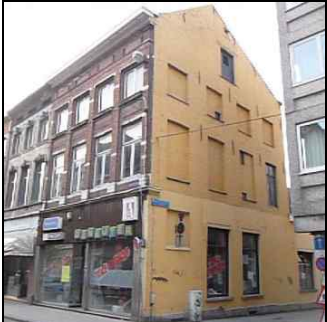
Afbraak Den Bollaert, historisch waardevol pand, hoek Diestsestraat - Lepelstraat

Het LHG wordt meer en meer door Leuvenaars verwittigd van de afbraak van waardevolle panden. Zo is in de Diestsestraat het linkerdeel van Den Bollaert (links), 17de-eeuwse woning, in de inventaris van het bouwkundig erfgoed opgenomen, afgebroken.