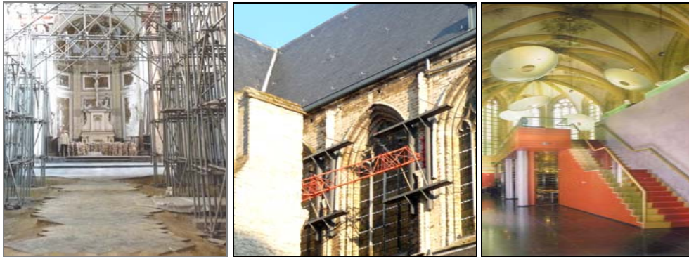
De vloer betreedbaar maken De stabiliteit opnieuw verbeteren Inspirerende herbestemmingen

Een betere betreedbaarheid van de oneffen vloerzone kan door het tijdelijk nivellieren van de vroeger gemaakte putten met gestampte aarde (zoals vroeger). Samen met het oordeelkundig bergen van de ontmantelde bouwelementen zal een selectief gebruik in de tussenperiode tijdens de stabiliteitswerken mogelijk blijven. Samen met de vzw Stad en Architectuur, kan na het recent positief signaal van de haalbare stabiliteitswerken, de begeleiding rond de herbestemming aanvangen. Het opsporen van voorbeelden van geslaagde herbestemmingen, ze bezoeken en kenbaar maken aan het brede publiek zal de weg vrijmaken voor creatieve oplossingen. Het evenement Kunst in de Steigers bewijst dat aangepaste sociaal-culturele activiteiten haalbaar zijn, zelfs in de nog niet gerenoveerde kerk.