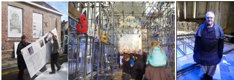
Informatie panelen van S&A - Publieke belangstelling Kunst in de Steigers - Deelnemer evenement

Ingaand op de vraag van de stad Leuven, om de herbestemming van deze site te begeleiden nam de vzw Stad en Architectuur via de werkgroep van de vrienden van de Sint-Jakobskerk het voortouw in het creëren van een publiek draagvlak voor de toekomstige bestemming van de kerk. De lijn is nu uitgezet.