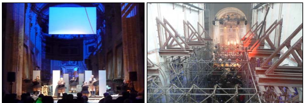
Theatervoorstelling door buurttheater Tartaren - Bovenzicht kerk tijdens optreden kinderkoor Scaletta

Thema's zoals de bouwhistoriek van de kerk, de betekenis van de plek voor de omgeving doorheen de eeuwen, de stabiliteit en dit jaar het collectief geheugen werden uitgelegd in panelen aan de kerk. Ondertussen werden initiatieven genomen, zoals de 'babbelbox', de 'kerkdeur op een kier', gidsbeurten, alsook diverse wandelingen, de vertellingen van het Compostella-Genootschap en info-avonden. Vooral het sociaal-culturele evenement van 'Kunst in de Steiger' van de vzw De Hulster, in samenwerking met Sacred Places, die instond voor een feeriek lichtkader, maakte ervoor dat de kerk op een organische wijze 'herbestemd' werd.