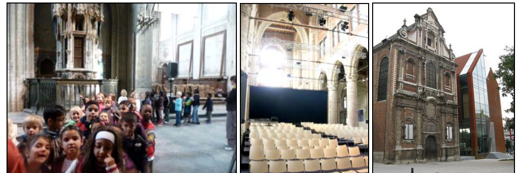
Bezoek schoolkinderen – Tekenwedstrijd Flexibel vloergebruik (NL) - Brigittinnenkerk oud/nieuw (B)

De rijke staalkaart van de aanwezige opeenvolgende bouwstijlen, laat een verdere evolutie en continuïteit van verbouwen en uitbreiden toe. De kerk zelf is een voorbeeld van 'moderne' uitbreidingen in elke periode. Een hedendaagse aanpak met nieuwe toevoegingen zal ook de kosten compenseren voor de minder renderende werken. Voorbeelden waarbij oud en nieuw elkaar aanvullen zijn er genoeg. De herbestemming zal echter enkel slagen als de sociaal-maatschappelijke context dit project wil 'dragen'.