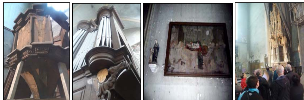
De preekstoel gestut Orgelkast beschadigd Schilderijen verwaarloosd Sacramentstoren veilig?

Er wordt gestart met het inventariseren van het nog aanwezig resterend en elders ondergebracht roerend erfgoed van de kerk, zoals schilderijen, koorgestoelte, biechtstoelen, preekstoel, heiligenbeelden, orgelkast, altaren, decoratieve muurbekledingen, sculpturen, enz. In overleg en samenwerking met de erfpachthouder, de stad Leuven, zal getracht worden om snel de nodige beschermingswerken van het nog aanwezige patrimonium verder aan te pakken om verdere diefstal, aftakeling en beschadiging te kunnen stoppen. Het verder optimaliseren van de bescherming en een eerste opkuis van de unieke sacramentstoren is één van de prioriteiten.