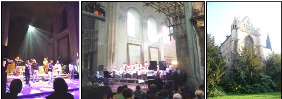
Jongerenoptreden Kinderkoor buurtschool - Kunst in de Steiger De deels verborgen kerk

Het project moet bestudeerd en uitgewerkt worden in een totaalplan rond de stadswijk. De aansluiting van deze site met het geplande project van Hertogeneiland en de ruimere omgeving rond het Sint-Jakobsplein, moet het project integreren. Het realiseren op korte termijn van een aangepaste publieke ruimte rond de Sint-Jakobskerk, nu grotendeels verborgen achter dennenbomen, is een element en voorwaarde om toekomstige investeringen door derden aantrekkelijker te maken.