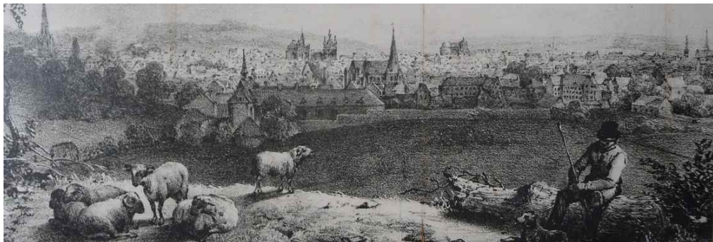
Zicht op Leuven vanaf de Luibank met centraal het stadhuis, St.-Pieterskerk en St.-Jakobskerk.

Bij de voorstelling van het jaarboek van 2009, in de kapel van het historisch gasthuis in Leuven, op die memorabele dag van 22 januari jl., namen we de gelegenheid waar om iedereen eraan te herinneren dat honderd jaar geleden – in 1910, in Leuven een vereniging werd gesticht met het doel de aandacht te vragen voor het onroerend erfgoed. Plots werd men zich bewust van een ingreep die het uitzicht van het stadscentrum ingrijpend zou wijzigen. De saneringsplannen van de Slachthuiswijk, waarbij een groot gedeelte van Leuvens middeleeuws patrimonium verdween om plaats te maken voor de Koning Albertlaan, (later Dirk Boutslaan), centraal uitlopend op de Sint-Pieterskerk doorheen een gore volkswijk.