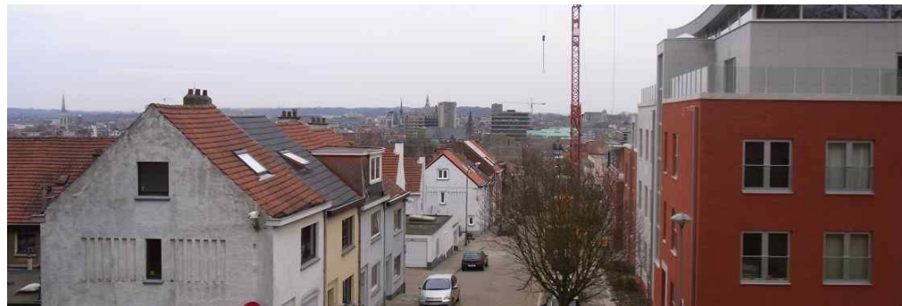
Ongeveer hetzelfde zicht vanaf de Luibank, anno 2010, verdwenen door de volgebouwde stad.