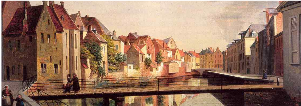
Naast de Vismarkt lag de 'Craenendonck', met hijskranen voor de overslag van goederen. (M)

De gunstige ligging van de stad op het kruispunt van de handelsweg en de Dijle was eveneens een niet te onderschatten meerwaarde voor haar economische ontplooiing. De Dijle was in die tijd stroomafwaarts pas bevaarbaar vanaf Leuven. Stroomversnellingen veroorzaakt door een geologische drempel ter hoogte van het Groot Begijnhof waren daar niet vreemd aan.