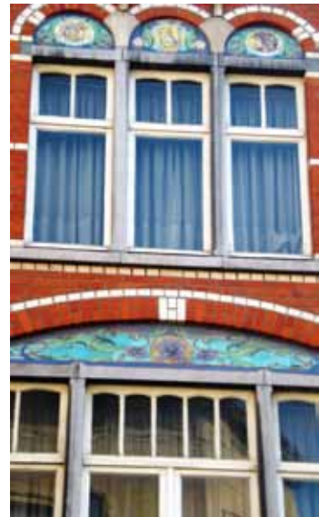
Geveldecoratie voormalig huis "Niclaes", Tiensestraat 128

Het fronton boven de vensterpartij op de eerste verdieping is gedecoreerd met geglazuurde tegels met botanische motieven, terwijl de blindboogjes boven de vensterpartij op de tweede verdieping een gestileerd mannen- en vrouwenhoofd bevat, evenals een siervaas. Dit pand staat sinds geruime tijd leeg en de toekomst ervan is onzeker.