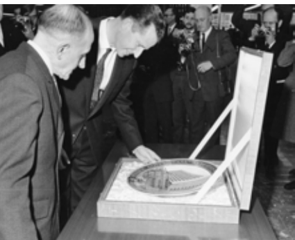
Constant Charlier en koning Boudewijn bij de herdenkingsschotel met voorstelling van de Koninklijke Bibliotheek Albert I (1969)

Tot aan zijn overlijden in 1964 blijft Jacques werkzaam in zijn atelier op de Diestevest. Samen met Constant vervaardigen de broers vanaf de jaren 50 vooral gepersonaliseerde sierborden en vazen , ontworpen ter gelegenheid van vieringen of verjaardagen, heel vaak gedecoreerd met een iconografie die geïnspireerd is op middeleeuwse miniaturen of gravures. Ook gehistorieerde tegeltableaux worden regelmatig in het atelier besteld.