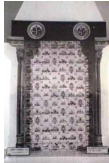
Schouwmantel met deco-ratie van “Delft-blauwe” tegeltjes (1947)