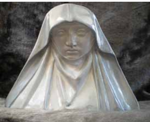
Gertrudisbuste, ontworpen bij de tentoonstelling in de abdij in 1930

Tot de utilitaire producten behoren tabakspotten, kandelaars, farmaciepotten en omhulsels voor bloempotten met bijhorende voetstukken. Die objecten zijn meestal uitgevoerd in de “Modern Style”.