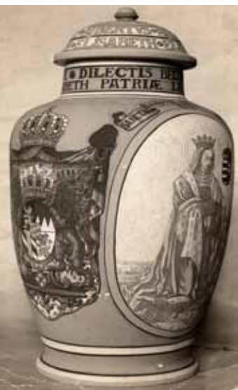
Siervaas met voorstelling van de HH. Albertus en Elisabeth, in 1930 aangeboden aan het koningspaar