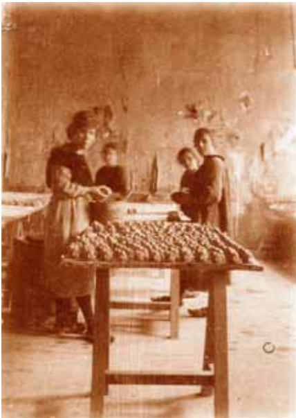
Kinderen in het atelier in de Sint-Geertruiabdij assi-mi-leren de poppen van de firma "REMDEO"