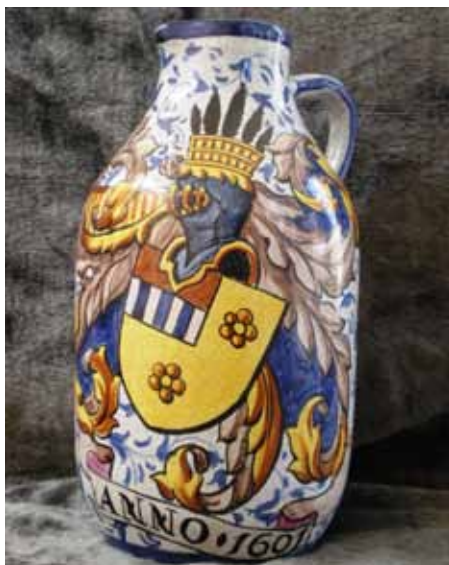
Kruik met decoratie 'à l'ancien'

Een derde techniek is het procédé met eveneens tinhoudend glazuur en een polychrome decoratie , die zowel voor utilitair als decoratief aardewerk wordt gebruikt. Het decoratieve aardewerk omvat allerlei potten, sierkruiken, tabakspotten, sierborden, die meestal in opdracht werden vervaardigd. Vaak zijn ze voorzien van wapenschilden, monogrammen, allegorische elementen of data. Men gebruikt ook motieven, ontleend aan de 16de of 17de eeuw, niet alleen voor het vaatwerk, maar ook voor het brandglas. Deze producten zijn uniek in hun genre en vinden hun kopers in abdijen, kloosters, en bij edelen in binnen- en buitenland.