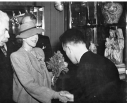
Bezoek van koningin Elisabeth aan de tentoonstelling in Brussel in 1947