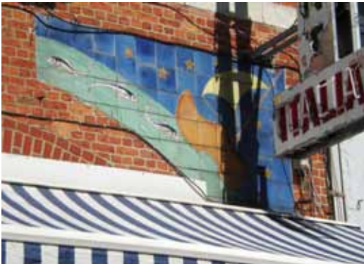
Tegeltabelau met vissen, gesigneerd Charlier Louvain (Savoyestraat)

De buitengevel van het huis nr. 11 in de Savoyestraat (thans restaurant Italia) is rechts gedecoreerd met een klomp, vlottend op water, waarin vissen zwemmen. Die voorstelling verwijst naar de oorspronkelijke benaming van de herberg "Le Sabot", die hier gevestigd was. Rechtsonder zien we de signatuur "A. Charlier 1930". De 'pendant' van dit tafereel, aan de linkerkant, werd een aantal jaren geleden verwijderd omwille van de Franstalige inscriptie. In het interieur werden enkele jaren geleden gehistorieerde tegels overpleisterd.