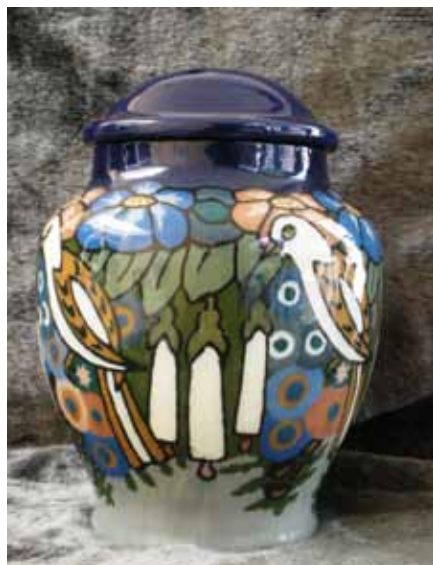
Siervaas in de "Modern style" of art deco