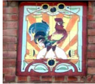
Tegeltabelau met haan (Regastraat 25)

Een mooi, nog bewaard voorbeeld bevindt zich in de Regastraat (nr. 25) , met een decoratie van zwaluwen en een boot, een haan, zwanen en een artdecovrouwenhoofd.