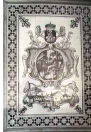
Tegeltableau met gezicht op het atelier en onderaan voorstelling van het bedrijf “Céramiques de la Dyle”, ontworpen voor de tentoonstelling in Brussel in 1947