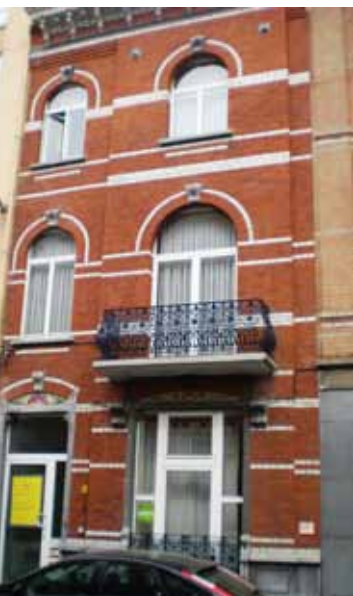
Gevel Maria-Theresiastraat 73 (1912)

Een andere woning, gelegen in de Maria-Theresiastraat (nr. 73) , werd eveneens opgetrokken in eclectische stijl, en het ontwerp uit 1912 is in de sokkel gesigineerd “C. Goemans / architecte”. Boven de deuroplijsting en de vensterboog van de benedenverdieping prijkt een gedecoreerd fronton van kleurrijke faiëncetegels met rode klaprozen en decoratieve ranken en krullen. Op de voordeur van deze woning werd enkele weken geleden een bouwaanvraag aangeplakt. De bedoeling hiervan is onduidelijk.