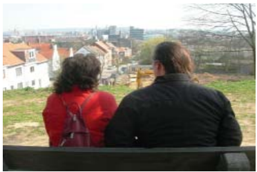
Stadsgezicht tot voor kort

Als LHG willen we onze inzichten rond de waardevolle uitzichten op onze stad meegeven en pleiten we dringend voor een globale visie rond het behoud van de nog resterende stadsgezichten zoals de Remyvest met de Luibank, de Mechelsevest en Verloren Kosttoren met de zone aan de Wijnperssite en voormalige site Van Humbreeck-Piron, Keizersberg en invalsweg Brusselsesteenweg. We volgen daarom de evolutie van de stadsontwikkeling rond de vesten vanaf de Tervuursepoort.