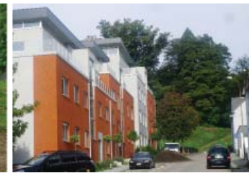
Bouwblok dat stadszicht verbergt

Het is op zichzelf terecht een goed idee om een uitzicht op Leuven te beogen maar - helaas - zoals de briefschrijver ook zelf aangeeft is recent het natuurlijke mooie panorama vanop de Luibank en dit zonder kunstmatige toren reddeloos verknoeid door de nieuwe hoogbouw vlak aan de voet van de Luibank. F1 en F2.