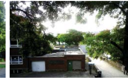
Verbroken stadszicht vanop de toren