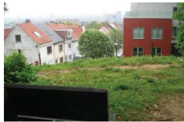
Uitzicht grotendeels verborgen 2011