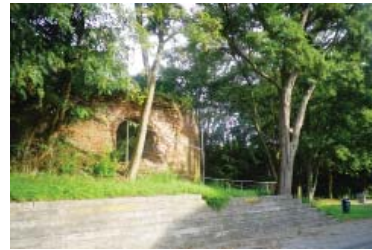
Verloren Kosttoren vandaag

Bij de voorstelling in 2003 van ons jaarboek XLI 'De Leuvense Prentenatlas deel II', suggereerde burgemeester Tobback om van de 'Verloren Kosttoren - of wat ervan overblijft - toch iets te maken, wat op toeristisch gebied een meerwaarde zou geven. Door de ruïne te gebruiken als een uitkijktoren, mits binnen de bestaande wand een stalen constructie aan te brengen met etages, van waaruit je zowel de stad als het weidse landschap aan de buitenzijde van de stad zou kunnen bewonderen. Men zou van daaruit zelfs bij klaar weer de toren van Mechelen en van Antwerpen kunnen zien.